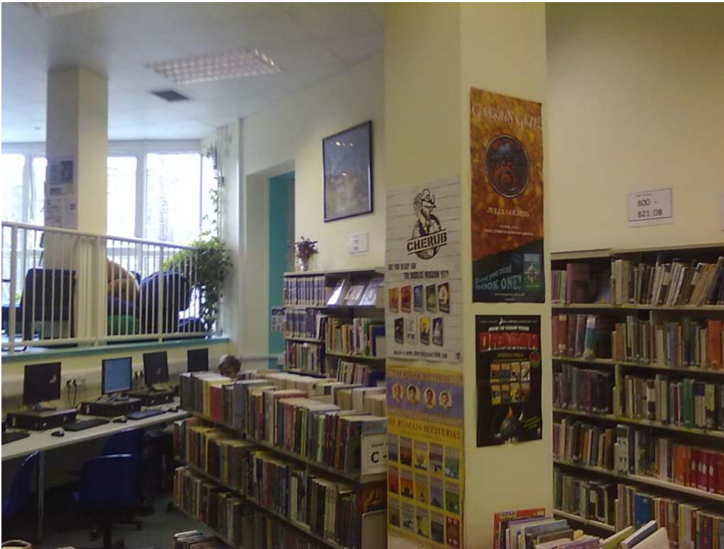
Kuva 7.) Yleisnäkymä Camden:n tyttökoulun oppilaitoskirjastosta

Camdenin tyttökoulun tiloista on havainnollisempi esittely heidän omilla Web-sivuillaan, jossa on myös mm. 360 astetta käsittävä havainnekuva kirjaston tiloista. Yllä oleva kuva ei näin anna tee oikeutta Camdenin tyttökoulun kirjaston tiloille.