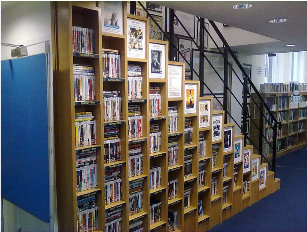
Kuva 2.) Emanuel School:n oppilaitoskirjaston DVD-kokoelma

Oppaanamme ollut kirjastonhoitaja kierrätti meitä myös muualla koulussa, jonka viktoriaaninen rakennus vaikutti historialliselta oppimisympäristöltä. Kaiken tämän voisi luulla tarkoittavan myös sitä, että yläluokkainen ja vanhat juuret johtaisivat vanhanaikaisiin opetusmenetelmiin, jossa annetaan painoarvoa opettajalle auktoriteettina. Näin ei asiaan kuitenkaan vaikuttanut olevan ja mm. ilmaisutaitoon sekä ennen kaikkea urheilumahdollisuuksiin oli panostettu huomattavasti.