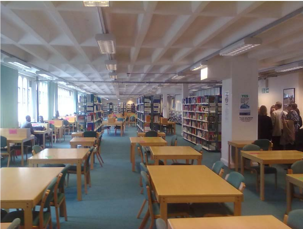
Kuva 9.) Yleisnäkymä Lambeth Collegen oppilaitoskirjastosta.

Moodle-oppimisolustaan. Kirjaston Web-palveluissa oli myös tarjolla mm. Web:n E-kirjapalveluja, kuten Ebrary.