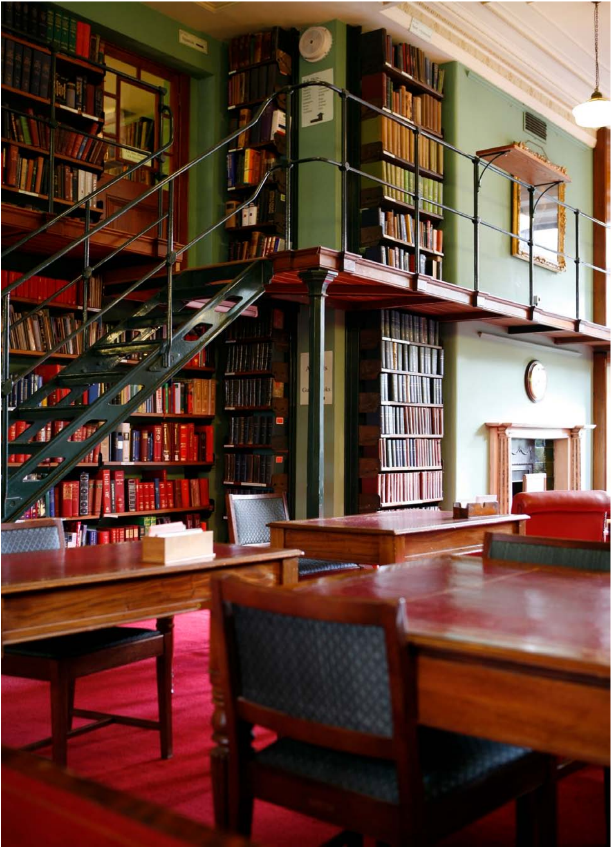
Kuva 6.) Mediatiedotokuva London Libraryn Web-sivuilta. ( http://www.londonlibrary.co.uk/press/General%20library%20images.htm )