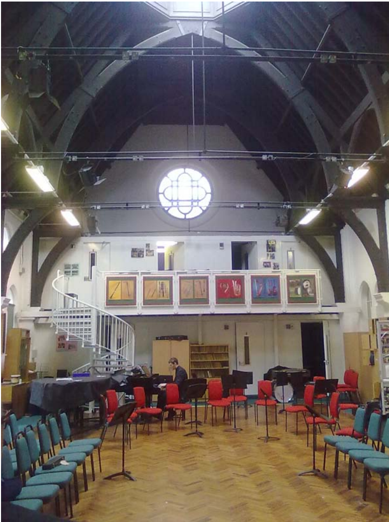
Kuva 3.) Emanuel School:n musiikin opetustiloja.