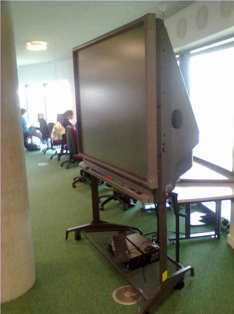
Kuva 11.) Lambeth College:n oppimiskeskuksen interaktiivinen valkotaulu