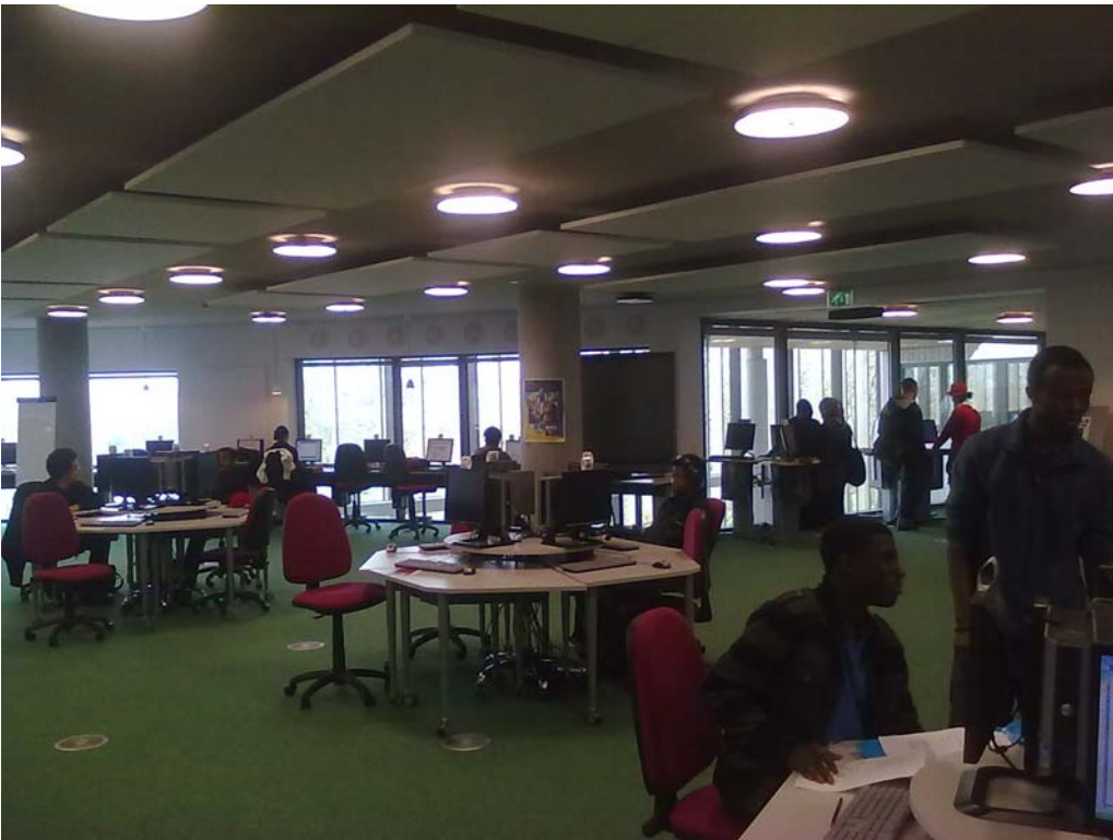
Kuva 10.) Yleisnäkymä Lambeth College:n oppimiskeskuksesta.