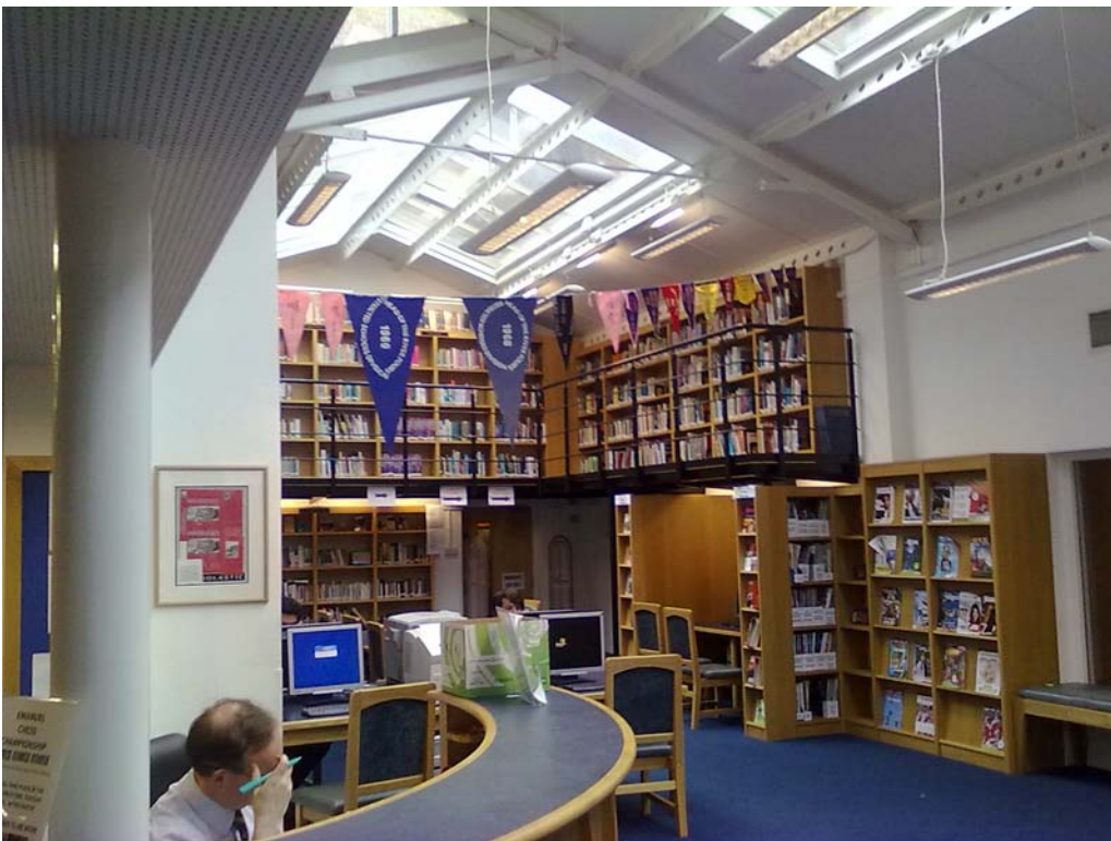
Kuva 1.) Yleisnäkymä Emanuel School:n kirjaston avokokoelmasta ja virkailijan tiskistä

Yllättävää oppilaitoskirjastossa oli e-aineistojen olemattomuus. Esittelijän kertoman mukaan päähuomio on lukemisen tukemisesta ja aineistovalinnat kohdistuvat kauno- ja tietokirjallisuuteen. Tietokoneita ja hiljaisia lukutiloja oli sijoitettu hyvin oppilaitoskirjastokokonaisuuteen. Huomion arvoista Emanuel School:n oppilaitoskirjaston tiloissa olivat myös kokolattiamatot, jotka yleisen tilan sisustuksessa saavat kummastuttaa ainakin suomalaista tarkastelijaa.